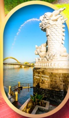
คาร์พดราท็อน