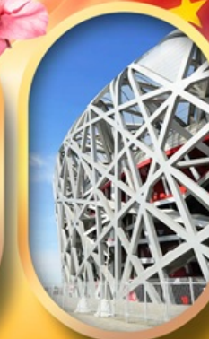
ผ่านชมสนามกีฬารังนก