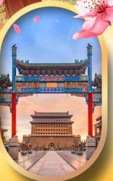
ถนนคนเดินเฮียนเหมิน