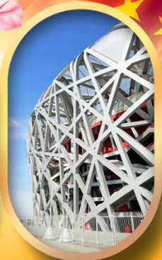
ผ่านชมสนามกีฬาฟาริงก