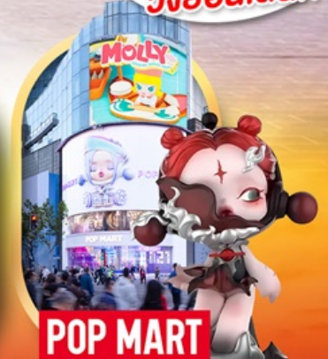
ช้อปปิ้งร้าน Pop Mart