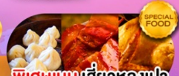
พิเศษเมนูเสี่ยวหลงเปา หมูตงพ้อ ไก่จอกาน เดินทาง ม.ค. - มี.ย. 69