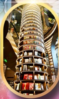
หอหนังสือจวงซูเก้อ