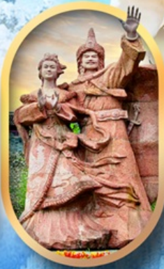
เมืองโบราณชางพาน