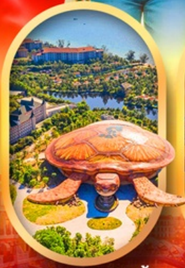
พิพิธภัณฑ์สัตว์น้ำ