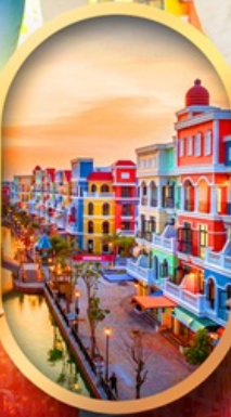
เวนิสแห่งเวียดนาม