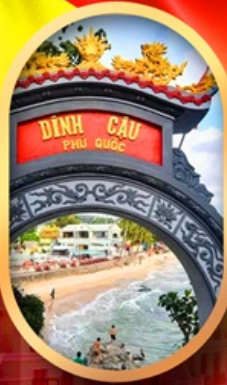
ศาลเจ้าติงเกา