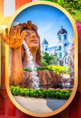
น้ำตกเทพพิหตุยง