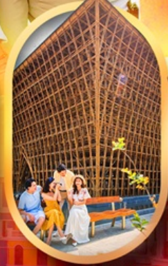
อาคารไม้ไผ่