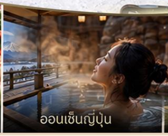
ออนเซ็นญี่ปุ่น