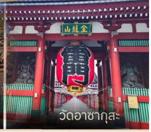
วัดวาซากุสะ