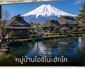
หมู่บ้านโอชิโนะฮักโค