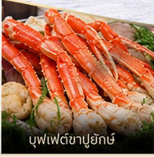
บุฟเฟต์ซาปูยักซ์