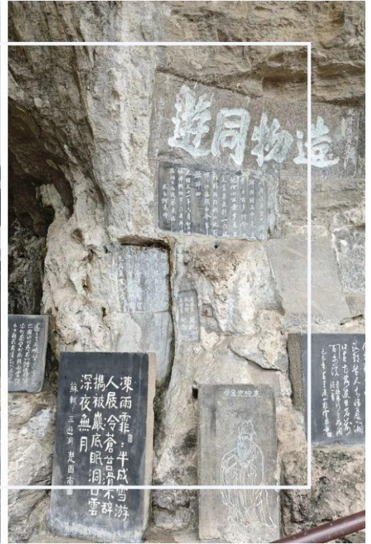
ถ้ำสามสหาย (SanYouDong)

เที่ยง บริการอาหารเที่ยง ณ ภัตตาคาร (มื้อที่ 14)