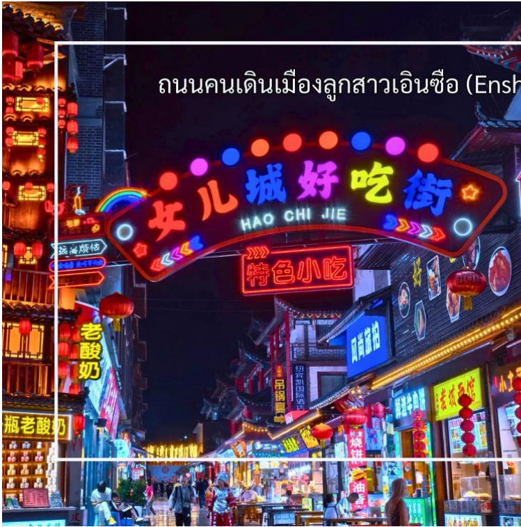
ถนนคนเดินเมืองลูกสาวเินซือ (Enshi Daughter City Pedestrian Street)