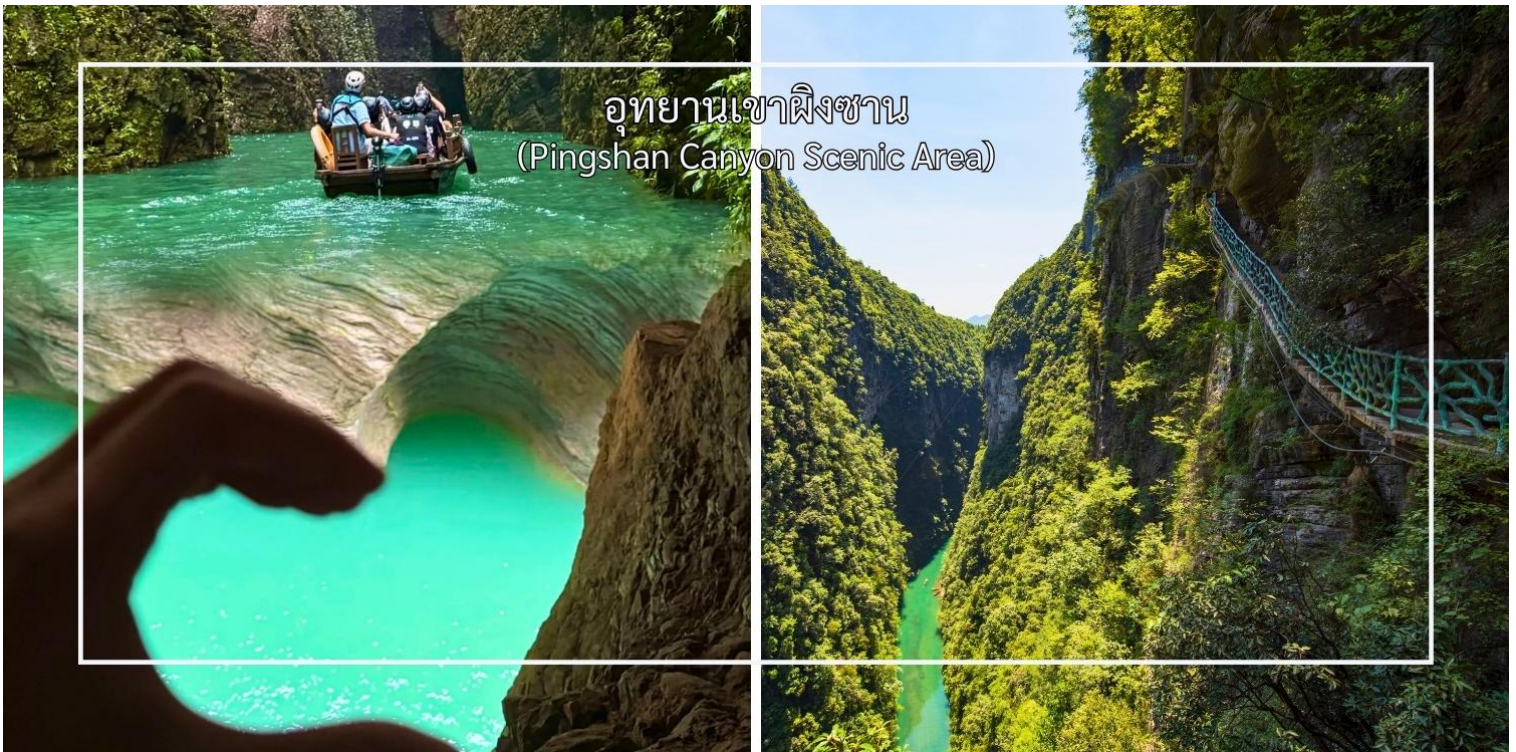
อุทยานเขาผิงซาน (Pingshan Canyon Scenic Area)

นำท่านสัมผัสความยิ่งใหญ่ที่เทียบระดับ 4A ที่ อุทยานเขาผิงซาน(Pingshan Canyon Scenic Area) หรือที่นักท่องเที่ยวรู้จักในชื่อ โกรกรูปหัวใจ (Heart-Shaped Gorge) เป็นหนึ่งในแลนด์มาร์กธรรมชาติที่สวยงามและมีเอกลักษณ์สวยงามด้วยรูปทรงโกรกที่คล้ายหัวใจซึ่งเกิดจากการกัดเซาะของสายน้ำและกระบวนการทางธรณีวิทยามายาวนาน ทำให้กลายเป็นจุดชมวิวที่โรแมนติกและเหมาะแก่การถ่ายภาพ ท่านสามารถเดินชมเส้นทางธรรมชาติรอบโกรก หรือมองจากจุดชมวิวสูงเพื่อเห็นภาพโกรกรูปหัวใจอย่างเต็มตา นอกจากความสวยงามแล้ว บริเวณนี้ยังเต็มไปด้วยธรรมชาติอันอุดมสมบูรณ์ ทั้งป่าไม้ ลำธาร และสัตว์ป่าที่อาศัยอยู่ในพื้นที่ ทำให้เป็นจุดหมายที่ผสมผสานทั้งความงดงามและความสงบแห่งธรรมชาติ (รวมล่องเรือ)