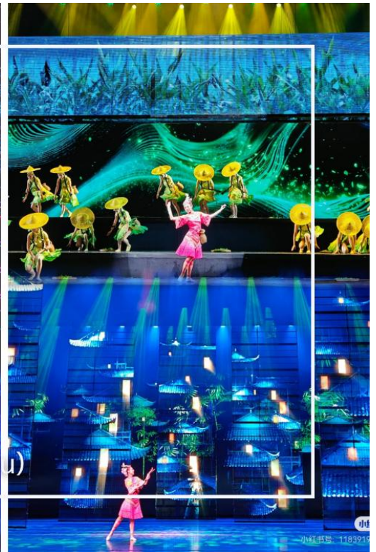
การแสดงโชว์ซีลิ่งคาปู (Xilan Kapu)

เดินทางเข้าโรงแรมที่พัก Xiazhou Hotel ระดับ 4 ดาวหรือเทียบเท่า