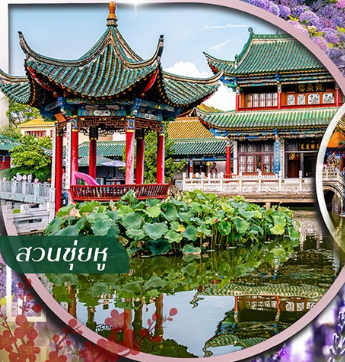
สวนชู่ฮู่