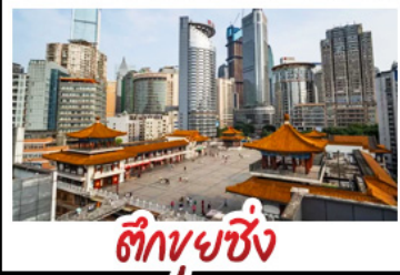
ตึกขุยซิ่ง

พระแกะสลักหินต้าจู้ - หลุมฟ้าสะพานสวรรค์ - เขานางฟ้า ตึกขุยซิ่ง - ตึกตะเกียบ หมู่บ้านโบราณฉือซื่อโจว