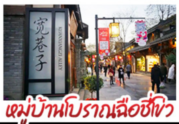
หมู่บ้านโบราณฉือซื่อโจว