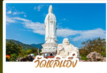
วัดเจดีย์แก้ว