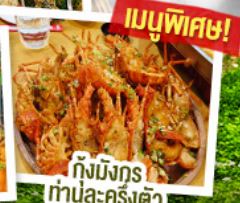
เมนูพิเศษ!