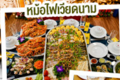
หม้อไฟเวียดนาม