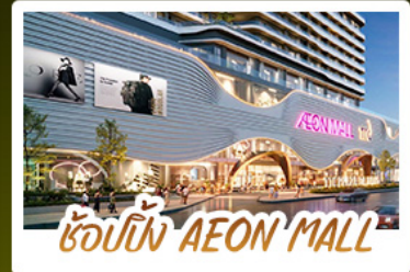
ช้อปปิ้ง AEON MALL