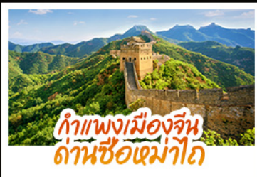
กำแพงเมืองจีน ด่านซื่อหม่าโต