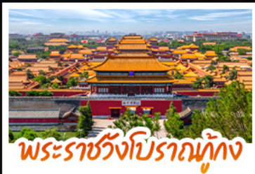
พระราชวังโบราณต้องห้าม