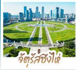
จั้ตรัสซั้งไ้