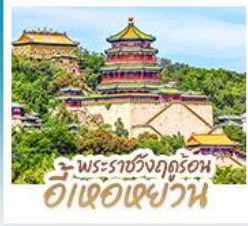
พระราชวังฤดูร้อน อี่เอ้อเฉ้ววัน

ทริปลั้ยวทึยง 2 เมือง ปักกั้ง-ต้าเหลียน • ทียงจืบฟัลยุโรป ณ เมืองเวนิสแห่งต้าเหลียน • สั้มผัสประสบการณั้้นกำเพงเมืองจีน ค่านจวียงกวน • ซ้อป ซิม ซิล ทีกถนนโบราณตงกวนและย่านชานหลั้กุน