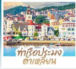
ทำเรือประมง ตาเหลียน