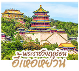
พระราชวังฤดูร้อน อี่เหอเฉียวาน

ทริปเดียวเที่ยว 2 เมือง ปักกิ่ง-ต้าเหลียน • เที่ยวจีนฟีลยุโรป ณ เมืองเวนิสแห่งต้าเหลียน • สัมผัสประสบการณ์ขึ้นกำแพงเมืองจีน ด่านจวิ๊ยกกวน • ซ้อป ซิม ซิล ที่ถนนโบราณตงกวนและย่านซานหลี่ถู่