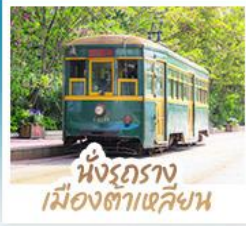
นั้งรถราง เมืองตาเหลียน