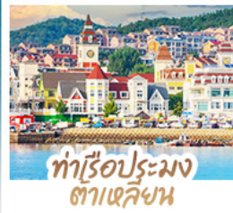
ทำเรือประมง ต้าเหลียน