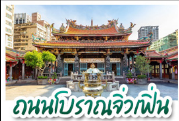
ถนนโบราณจิวเฟิน