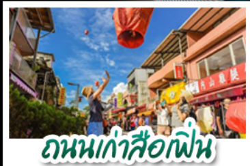
ถนนเก่าลีอูเฟิน