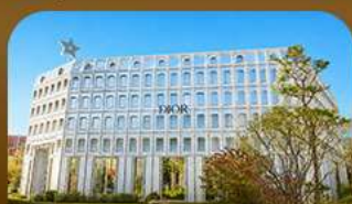
ย่านชองซู