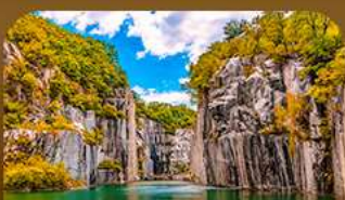
เขาน้ำตกป่าเมืองโพซอน

คามาหาใบไม้เปลี่ยนสีสุดโรแมนติก ชมวิวเมเปิ้ลหลากสีจากสะพานแขวนรูปตัว Y แห่งเมืองโพซอน สัมผัสความงดงามของโพซอนอาร์ทวอลล์ • เดินเล่นท่ามกลางต้นแปะทิวและเมเปิ้ลในพระราชวังเคียงบกกรุง สมบูรณ์บ้านอันออกกลางบรรยากาศช่อนยุค และปิดท้ายด้วยทุ่งหญ้าสีทอง ณ สวนฮานิล แลนด์มาร์กยอดนิยมของกรุงโซล ในช่วงฤดูใบไม้เปลี่ยนสีที่สวยงามที่สุด