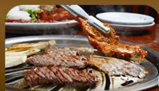
เมนูย่างสไตล์เกาหลี