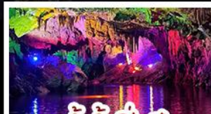
ถ้ำน้ำเป็นสี