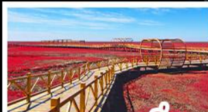
หาดแดงผานจิน