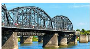
สะพานหวาดถานตง

2 มหัศจรรย์ธรรมชาติระดับโลก "หาดแดงผานจิน" คู่กับ "ถ้ำน้ำเป็นสี" ยื่นมองฝั่งเกาหลีเหนือที่ตามตง • ชมความยิ่งใหญ่ของพระราชวังเส้นหยางกู่กิง