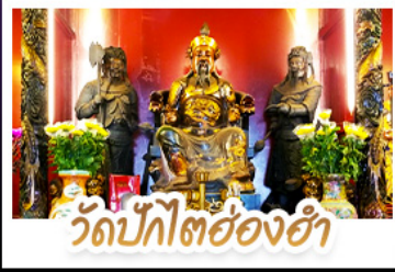
วัดปึกไต้ฮงฮ่า

นั่งกระเช้าเองปีงสักการะพระใหญ่เทียนถาน • ขอพรองค์เซกง โชคลาก การเงินและธุรกิจ เทพเจ้าปึกไต้ฮงฮ่า ขอพรเรื่องความสำเร็จในชีวิตและการทำงาน • วัดหวังต้าเซียน สักการะสิ่งศักดิ์สิทธิ์ เสริมมงคลชีวิต • เจ้าแม่กวนอิมฮงฮงฮ่า ขอเรื่องเงิน ทรัพย์สิน และความมั่งคั่ง • อิศระท่องเทียว 2 วัน เลือกซื้อบัตรคัสซีนีแพลนคหรือซ้อปปีงใจ