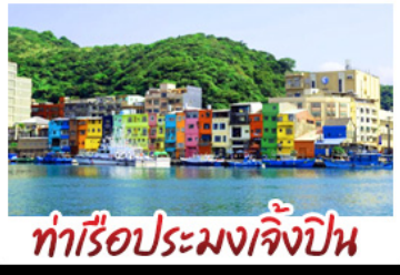
ทำเรือประมงเจิ้งปิ่น

รถไฟสายโบราณอาลีซาน - ตักไทเป 101 ประมงเจิ้งปิ่น - จิวเฟิน - ล่องเรือทะเลสาบสุริยัมจินตรา ถานเมบูเค็ด เสี่ยวหลงเปา & ปลาประจานาธิบดี ซ้อปิ่ง 3 ย่านดัง : ซิเหมินตง - ไทจงไนท์มาร์เก็ต - MITSUI OUTLET