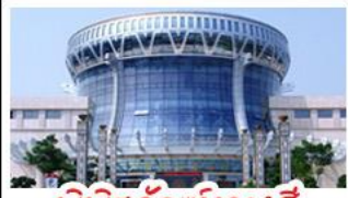
พิพิธภัณฑ์กวางสี

สวนสนุก FANTASYLAND - หมู่บ้านสไตล์ยุโรป พิพิธภัณฑ์กวางสี - ถนนคนเดินสามตรอกสองซอย ท่าเรือกิ่งจื่อ - ศาลเจ้าแม่กวนอิมพันกร เมนูพิเศษ อาหารกวางตุ้ง , สุกีชาบูหม่าล่า