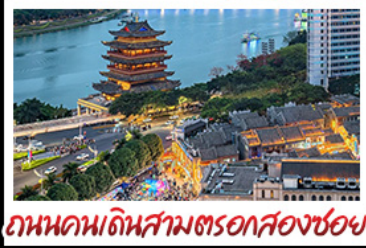
ถนนคนเดินสามตรอกสองซอย