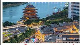
ถนนคนเดินสามตรอกสองซอย