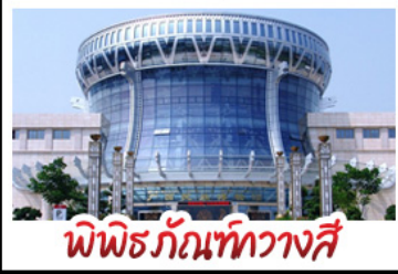
พิพิธภัณฑ์ทิวาสี

สวนสนุก FANTASYLAND - หมู่บ้านสไตล์ยุโรป พิพิธภัณฑ์ทิวาสี - ถนนคนเดินสามตรอกสองซอย ทำเรือถึงจ้อ - ศาลเจ้าแม่กวนอิมพันกร เมนูพิเศษ อาหารกว้างต้ง , สุกี้ซาบูหมาล่า