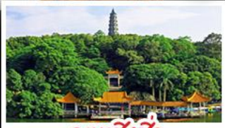
ภูเขาชิงชิว