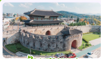
ป้อมข้าหลวง