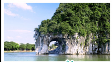
เขางวงช้าง