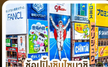
ซ้อปั้งชินโซบาชิ และโดตงโมริ