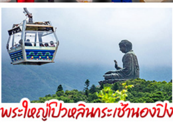
พระใหญ่ไผ่หลินและกระเช้าเองปีง

2UHKG-TG005 | 4 วัน 3 คืน | THAI | อีปเกรดกระเช้าเองปีง 1 เกี้ยว Crystal Cabin | ย่านจิมซาจุ่ยหรือย่านมงก๊ก โรงแรม 4 ดาว