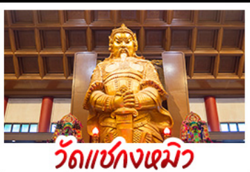
วัดเขกงเมมัว