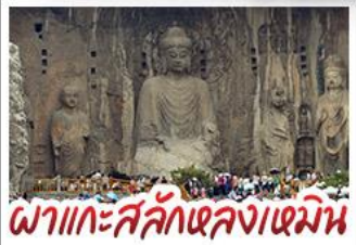
พลาแกะสลักหลงเหมิน

เที่ยวครบ 4 มรดกโลก ถ้ำหลงเหมิน - สุสานจีนชิงฮ่องเต้ - วัดเส้าหลิน หมู่บ้านไต้คินसानโจว - หมู่บ้านกัวลี้ยงชุน