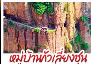
หมู่บ้านกัวลี้ยงชุน