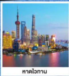
หาดไว่กาน