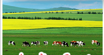
ทุ่งหญ้าเออร์ดอส