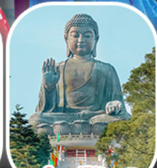
พระใหญ่โป่วหลิน