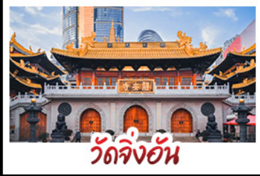
วัดจิ้งอัน