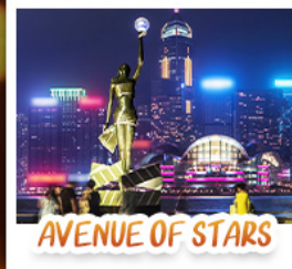
AVENUE OF STARS