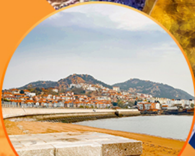
ซาจื่อโป่ว