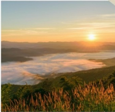
ทอย (สมอทาว)