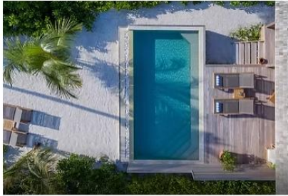
Beach Pool Villa