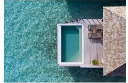
Ocean Pool Villa