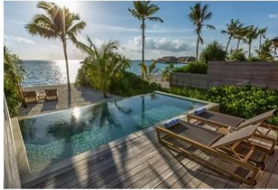
Beach Sunset Pool Villa