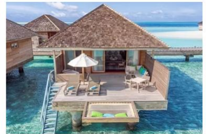
Romantic Ocean Villa