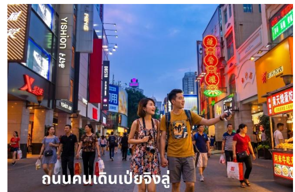
ถนนคนเดินเป่ย์จิ้งจู่

ให้ท่านได้ ช้อปปิ้ง ถนนคนเดินปักกิ่ง (Beijing Road) เป็น ถนนคนเดินที่มีร้านค้าอยู่ทั้งสองข้างทาง เป็นย่านแฟชั่นยอดนิยม มีสินค้าแบรนด์เนมต่างๆ อาทิเช่น เสื้อผ้า กระเป๋า รองเท้า และ ของที่ระลึกอีกมากมาย