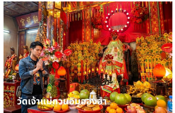
วัดเจ้าแม่กวนอิมสองอำ

นำท่านเดินทางสู่ วัดเจ้าแม่กวนอิมสองอำ (Kun Im Temple Hung Hom) เป็นวัดเจ้าแม่กวนอิมที่มีชื่อเสียงอีกแห่งหนึ่งใน ฮองกงขอพรเจ้าแม่กวนอิมพระโพธิสัตว์แห่งความเมตตาให้ช่วย คุ้มครองปกป้องรักษา วัดเจ้าแม่กวนอิมที่ Hung Hom หรือ 'Hung Hom Kwun Yum Temple' เป็นวัดเก่าแก่ของฮองกง ซึ่งสร้างขึ้นตั้งแต่ปี ค.ศ. 1873 ถึงแม้จะเป็นวัดขนาดเล็กที่ไม่ได้ สวยงามมากมาย แต่ก็เป็นวัดเจ้าแม่กวนอิมที่ชาวฮองกงนับถือ มาก ในแทบทุกวันจะมีผู้คนมาบูชาขอพรกันแน่นวัด ถ้าใครที่ ชอบเสียงเซียมซีเขาบอกว่าที่นี่แม่นมากที่พิเศษกว่านั้น นอกจากสักการะขอพรแล้วยังมีพิธีขอของอั้งเปาจากเจ้าแม่ กวนอิมอีกด้วย