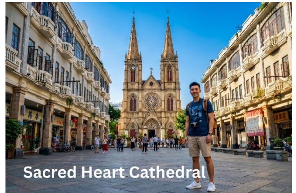
Sacred Heart Cathedral

นำท่านชม มหาวิหาร Sacred Heart Cathedral เป็นหนึ่งในสถาปัตยกรรมที่ โดดเด่นและสำคัญของเมืองกวางโจว