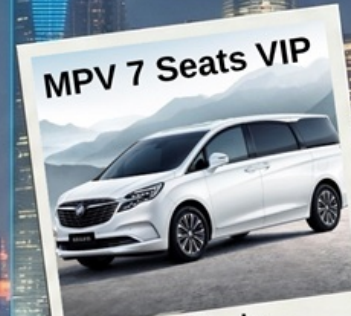
MPV 7 Seats VIP