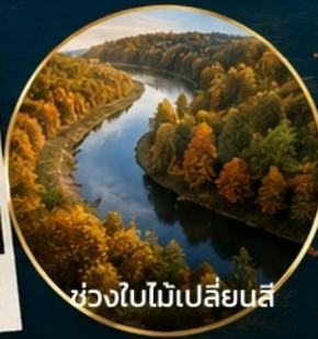
ช่วงใบไม้เปลี่ยนสี