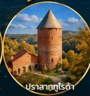
ปราสาทกูโรต้า