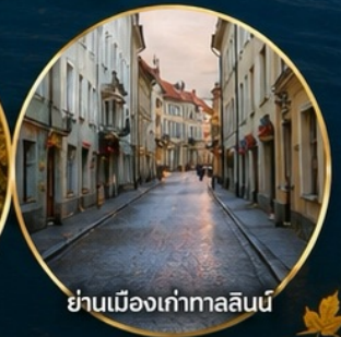
ย่านเมืองเก่าทาลลินน์