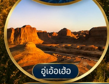
อุเอ้อเอ้อ