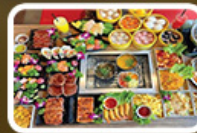
ปิ้งย่าง BBQ