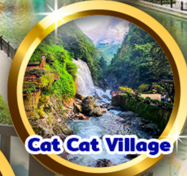
Cat Cat Village