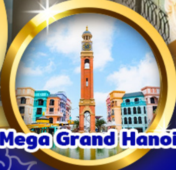
Mega Grand Hanoi