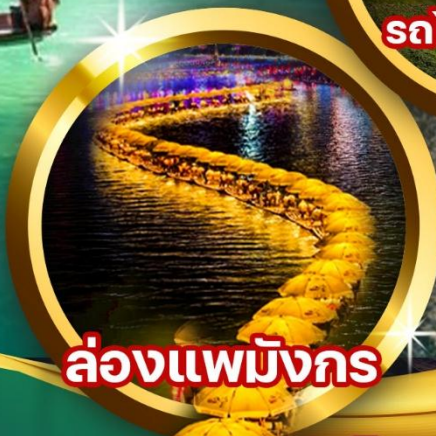
ล่องแพมังกร