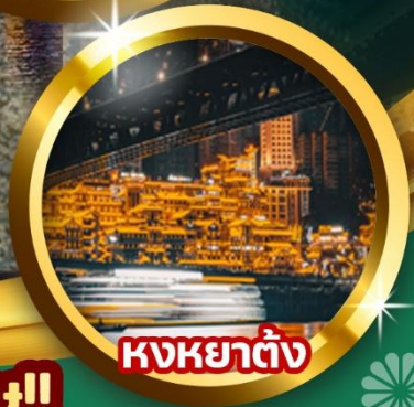
หงหยาดั่ง