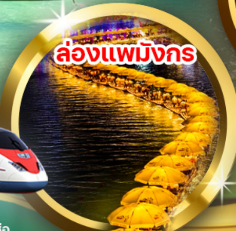
ล่องแพมังกร