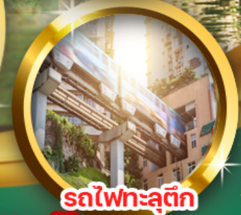
รถไฟทะลุтик