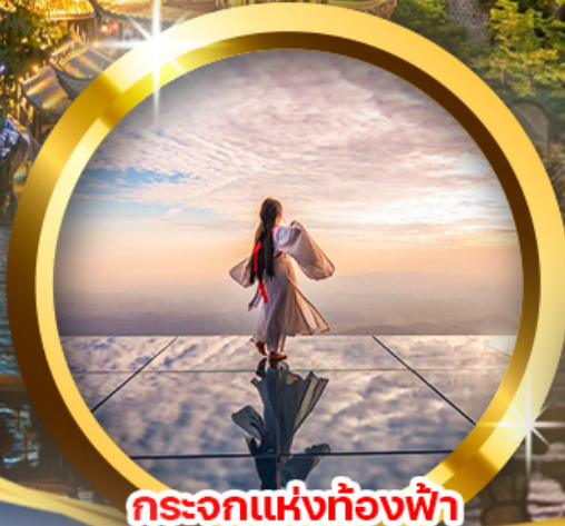
กระบอกแห่งท้องฟ้า