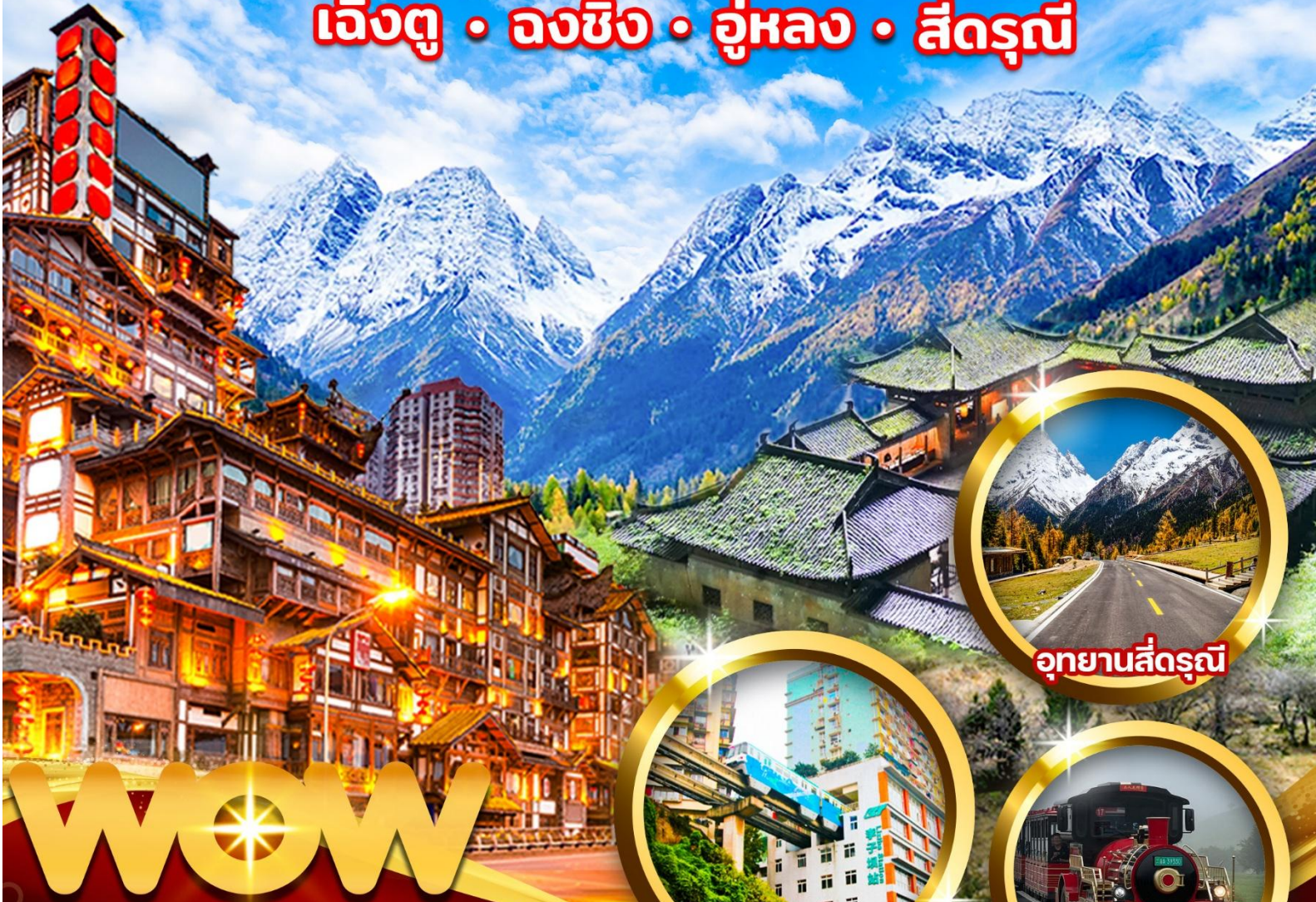
อุทยานสิ็ดรุณี