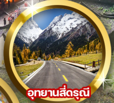
อุทยานสี่ดรุณี