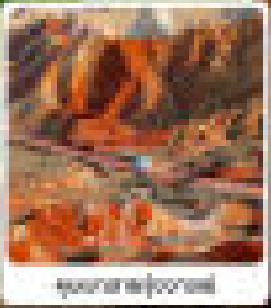
ทะเลทรายดูหวง