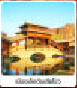
เมืองโบราณ