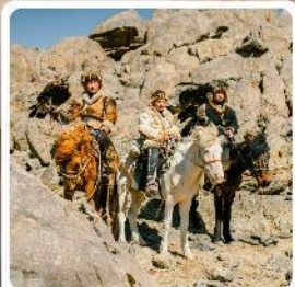
ชนเผ่ามองโกล