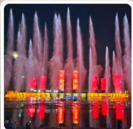
น้ำพุคังปาสือ