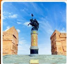
เขตท่องเที่ยวจงกิสข่าน