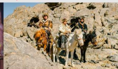
ชนเผ่ามองโกล

*ทางบริษัทฯ ขอสงวนสิทธิ์ในการสลับโปรแกรมทัวร์ตามความเหมาะสมขึ้นอยู่กับสถานการณ์หน้างาน โดยคำนึงถึงผลประโยชน์ของลูกค้าเป็นสำคัญ