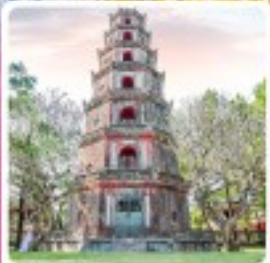
วัดเทียนมู่

ไอโกล์ ทริปดานังสุดปัง พักบานาฮิลล์ เช็คอินสะพานมือยักษ์ เที่ยวหมู่บ้านฝรั่งเศส ปิดท้ายฮอยอันเมืองโคยไฟ