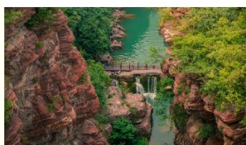
อุทยานสวรรค์หยุนโตซาน