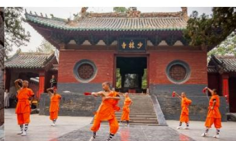
ชมโชว์กังฟูเส้าหลิน

*ทางบริษัทฯ ขอสงวนสิทธิ์ในการสลับโปรแกรมทัวร์ตามความเหมาะสมขึ้นอยู่กับสถานการณ์หน้างาน โดยคำนึงถึงผลประโยชน์ของลูกค้าเป็นสำคัญ