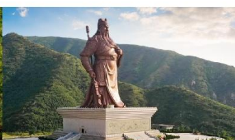
บ้านเกิดกวนอู