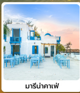
มารีนาคาเฟ่