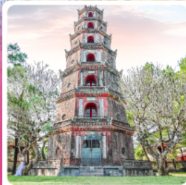
วัดเทียนมู่