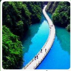
หุบเขาสิงโต