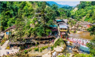
หมู่บ้านก๊ต ก๊ต