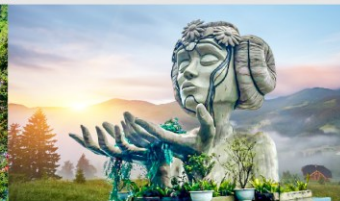
โมอาน่าคาเฟ่

*ทางบริษัทฯ ขอสงวนสิทธิ์ในการสลับโปรแกรมทัวร์ตามความเหมาะสมขึ้นอยู่กับสถานการณ์หน้างาน โดยคำนึงถึงผลประโยชน์ของลูกค้าเป็นสำคัญ