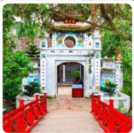
วัดหง็อกเซิน

• โฮลท์ พิชิตยอดเขาฟานซีปัน หลังคาแห่งอินโดจีน สัมผัสหมู่บ้านชาวเขา หมู่บ้านก๊ต ก๊ต